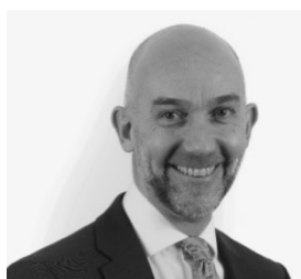
Adrian Crompton, Archwilydd Cyffredinol Cymru