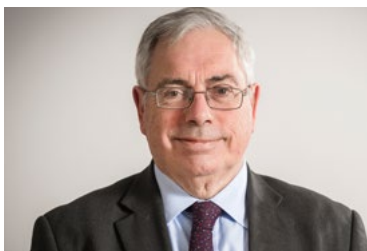
Huw Vaughan Thomas Auditor General for Wales

Rydym yn gobeithio y byddwch yn gallu rhoi o'ch amser i ddarllen y ddogfen ymgynghori fer hon, ac edrychwn ymlaen at glywed eich safbwyntiau.